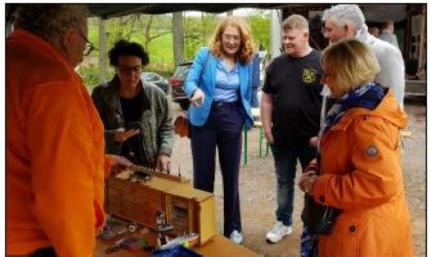
Bild 3: Die Ministerin Petra Berg beim Stand des Referats Fliegenfischen

Für alle Beteiligten des Fischereiverbandes Saar war es ein erfolgreicher Tag gewesen. Vielen Gästen des Frühlingsfestes konnten Informationen übermittelt und weitergeben werden. Und wer weiß, vielleicht sehen wir den ein oder Anderen bei einem der nächsten Veranstaltung wieder.